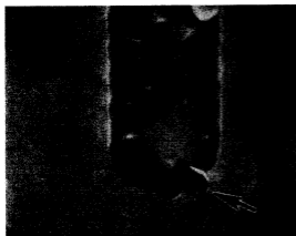
(a) 論理 IC エミッタ部の ESD による損傷